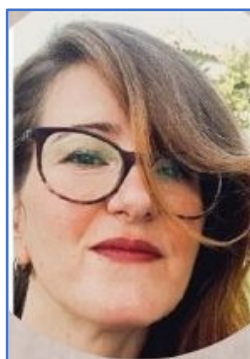
Candela León Comunicación